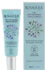
Rosalique 3 i 1, indhold 30 ml. Pris kr. 399,00