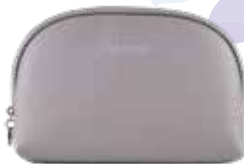
Rosalique Makeup Pung m/ 1 stk. Rosalique og 1 stk. Rosalique Miracle Foundation Brush Pris kr. 649,00